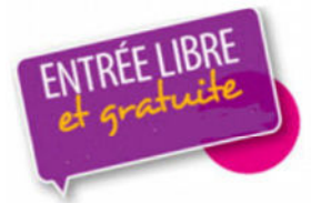
Table ronde :

Organisée par le collectif Justice des mineurs 63