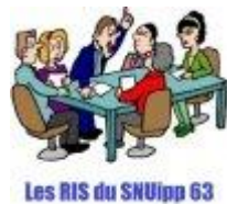
Les RIS du SNUipp 63