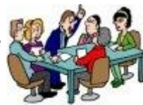
Les RIS du SNUipp 63