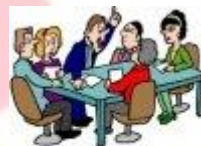
Les RIS du SNUipp 63